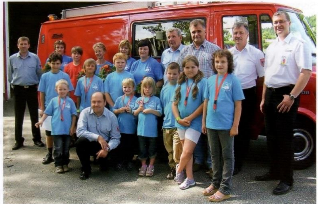
Gründung der Kinderfeuerwehr 2011.