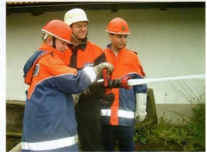
Jugendübung mit der neuen Turbo Spritze 2000.