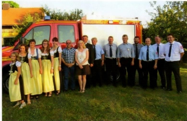
Ehrengäste und Führungskräfte bei der Fahrzeugsegnung.